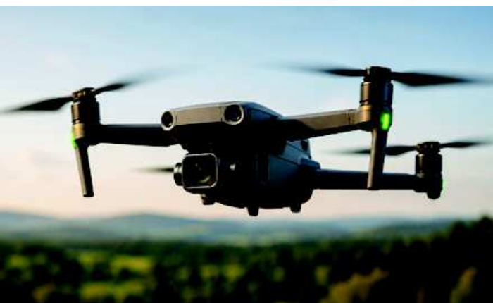
Pouze ilustrační fotografie.

Těší nás, že podpořené projekty nezůstávají pouze „na papíře“, ale jsou aktivně realizovány a přinášejí konkrétní přínosy do praxe.