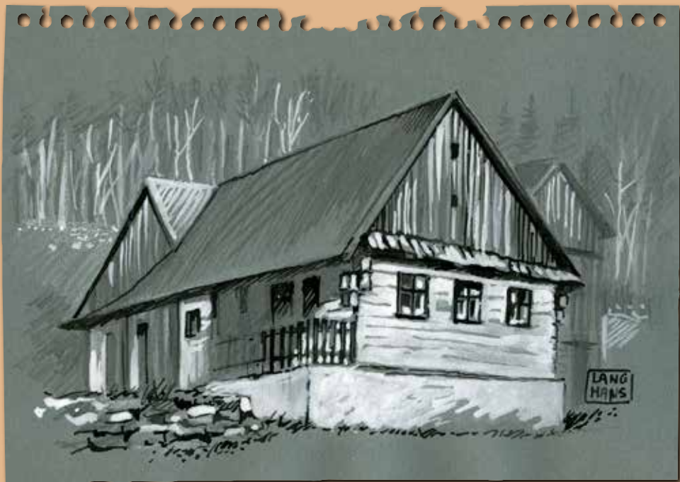
Necořské chalupy pohledem Pavla Langhans