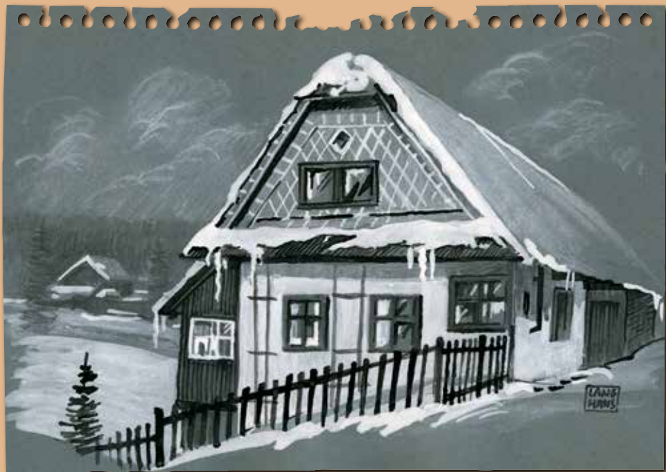
Necořské chalupy pohledem Pavla Langhans