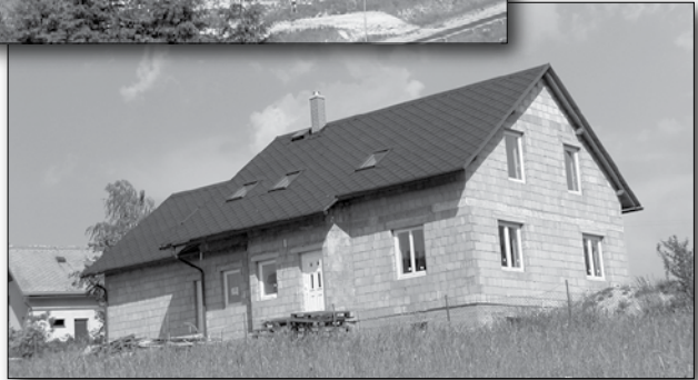
Na všech stranách obce vyrůstají nové rodinné domky