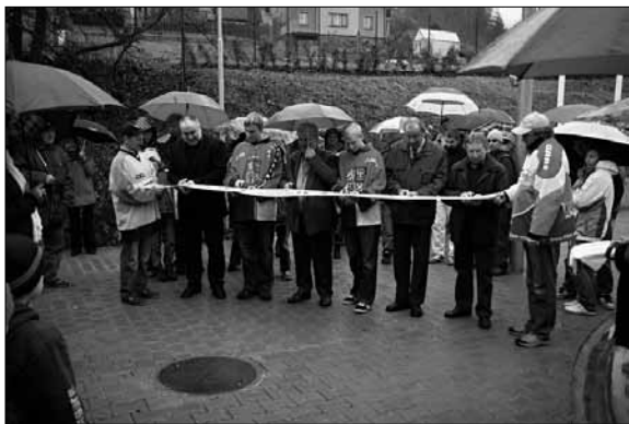
Slavnostní otevření Centra volnočasových aktivit

Samozřejmostí je i sociální zařízení včetně wc pro invalidy, dvě sportovní šatny se sprchami. To vše kompletně oploceno.