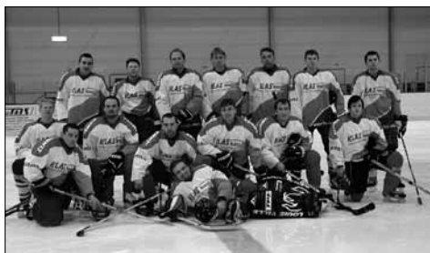
HC Klas Nekoř