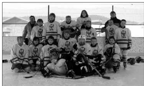
Hokejoví přeborníci okresu