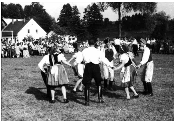
Dožínky v roce 1948