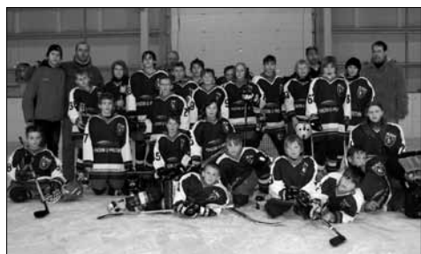
Současná hokejová mládež