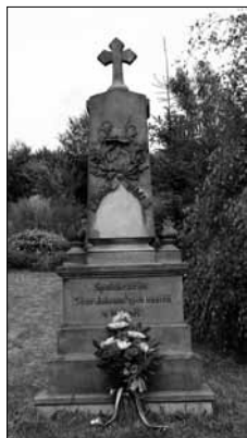
Pomník po rekonstrukci