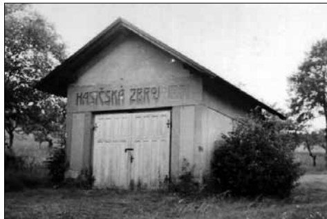
Hasičská zbrojnice v Údolí Pokračování příště.

Pořízení přenosné motorové stříkačky v roce 1941, se neobešlo bez těžkostí, peněžních výpůjček a bez přesvědčování, že hydranty pro jejich nízký tlak nevyhovují moderním požadavkům. Její pořizovací hodnota byla 24.000,-k.