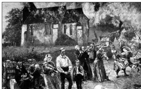
Dobové výjevy požárů