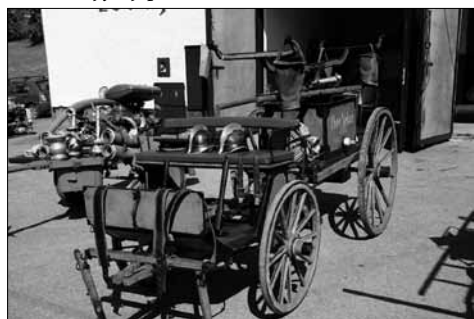
První koněpřežná stříkačka v Nekoři r. 1874