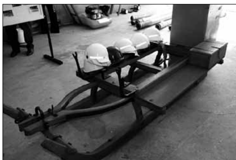
Sáně ke stříkačce 1874