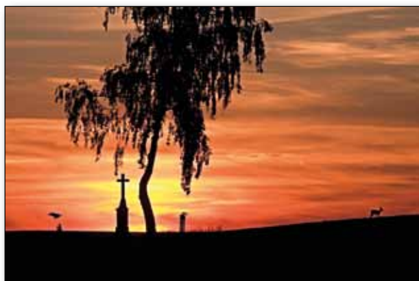
Krásy Necoře fotoaparátem Jiřího Krejisy a Lukáše Krále