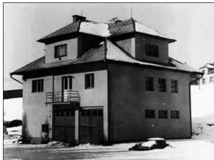
Nová hasičárna a obecní úřad cca 70. léta