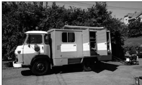
Avia – čtvrté hasičské auto