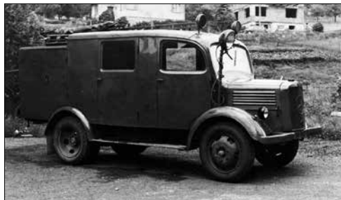
Mercedes Benz – první hasičské auto

V roce 1946 obec zakoupila pro požární sbor z pražské výzbrojny CO hasičské auto Mercedes Benz