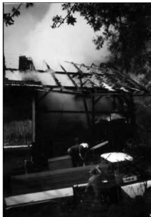
Požár skladováků na Vejrově

Oslava 300 let od založení osady Údolí, se konala 6. července 1993. Oslavu pořádala obec, za vydatné pomoci členů hasičského sboru, kteří měli na starosti občerstvení a pořádkovou službu. Sbor také vystavoval starou techniku uloženou v opravené Údolní zbrojnici. Oslav se zúčastnilo přes 1000 občanů z Nekoře, Studeného, Pastvin a původní obyvatelé, kteří se z Údolí vystěhovali do pohraničí v roce 1945.