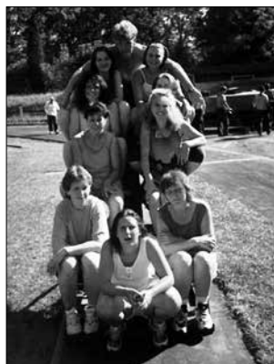
Družstvo žen - Krajské kolo 1999

V roce 1998 bylo založené družstvo žen. Celkem mělo 9 členek a zúčastnilo se okreskové soutěže v Jablonném nad Orlicí. V roce 1999 postoupilo družstvo žen do krajského kola v požárním sportu, které se konalo 4. července v Dobrušce a skončily na 7. místě. Další úspěch našich žen byl v roce 2002,