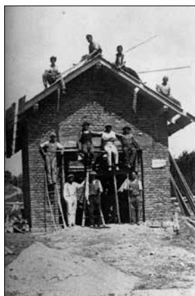
Hasičská zbrojnice v Údolí při stavbě 1932

kteří provedli přípravné a pomocné práce s opravou související. Naši členové postavili lešení, skryli starou krytinu, opravili poškozená místa bednění a po položení nové krytiny provedli úklid okolo Údolní zbrojnice. Celkem odpracovali 64hod.