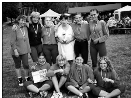
Družstvo žen krajské kolo 2002