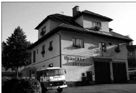
Dnešní podoba hasičské zbrojnice v Nekoři

V pondělí 22. února 1993 ve večerních hodinách vznikl požár v rekreační chalupě Nekoř 197 p. Ulrichová, trvale bytem v Ostravě. Požár vznikl od přetopených kamen a vadného kouřovodu. Uživatelé, vnučka majitelky, odešla na hřiště. Škoda byla na vnitřním zařízení. Prohořelé stropy, kryt střechy a obvodové zdivo se zachránilo. Zásah provedl požární útvar ze Žamberku a místní sbor vydatně pomáhal. Do rána potom naši členové hlídkovali.