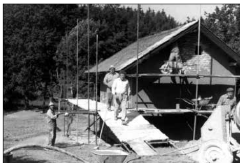
Při opravě v r 1989