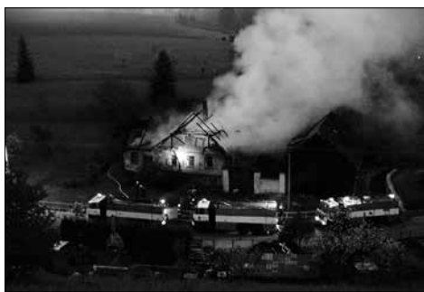
Kapounův statek v plamenech

V létě 21. srpna 2002 zasáhly Čechy katastrofální povodně především v povodí Vltavy. Náš sbor se přihlásil na pomoc postiženým obcím. Humanitární organizací „Člověk v tísní“, jsme byli přiděleni k Mělníku do obce Hořín. Po dovybavení Avie gumovými rukavicemi, desinfekčními prostředky, košťaty, lopatami a dalšími prostředky, vyrazila první skupina na pomoc. Vypadalo to tam jako po válce, některé domy napul spadlé, ostatní plně blá-