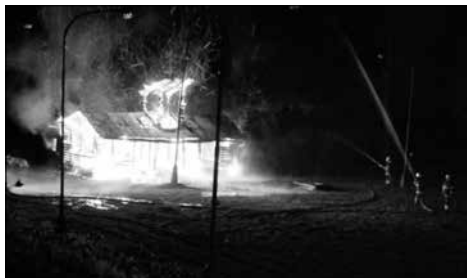
Staré kabiny v plamenech