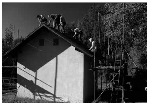
Výměna krytiny 2011