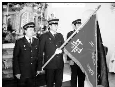
Při křtu nového praporu

kdy se dostaly opět do krajského kola, pořádaném ve Vysokém Mýtě. V tomto roce skončily na 3. místě.