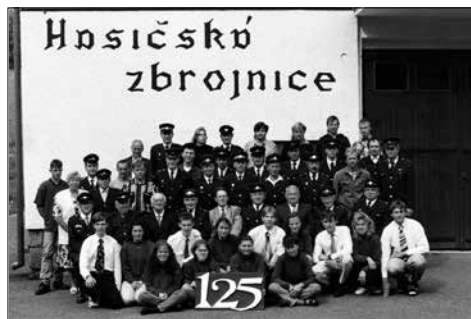
Hromadná fotka členů sboru v roce 1999

nutné a potřeba. Večer byla část hasičů odvolána do strojovny Pastvinské elektrárny, kde bylo nutné odčerpávat vodu. Celého povodňového zásahu se zúčastnilo 25 členů sboru.