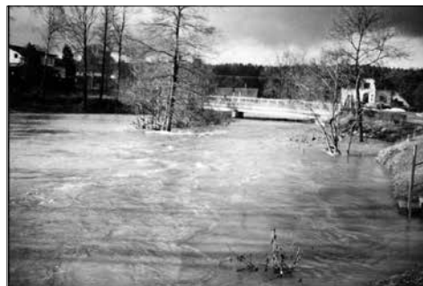
Voda u mostu

Na podzim, 8. září 2000, nabídl pan Trýb (nový majitel továrny)