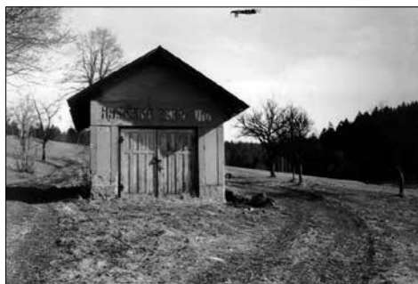
Zbrojnice před rekonstrukcí v r 1989

Jelikož při stavbě zbrojnice byl z části použit starší eternit a ten co byl nový, byl ještě horší, bylo rozhodnuté překrýt celou střechu novým eternitem. Veškeré plechování bylo udělané nové a bylo řádně natřené.