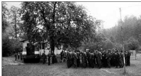
Okrskové cvičení okolo r. 1989 – za třešni je již naše bou-da

počinem byla založená tradice každoročního pořádání hasičského táboráku pro spoluobčany a spřízněné lidi z okolí.