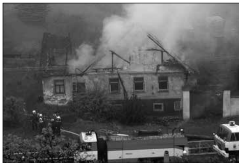
Ráno po požáru

ta. V celé obci nešel elektrický proud, voda tekla, ale nebyla pitná. Hladina vody v nejvyšším místě dosahovala čtyř metrů. Ihned jsme se zapojili do práce. Pomáhali jsme s vynášením zničeného zařízení z domů, vymývání místností od bahna, rozebírání části zničených domů. Po čtyřech dnech byla první skupina vystřídána skupinou druhou, která pokračovala v odklizení škod. Byla to velká zkouška naší techniky i lidí. Vše dopadlo na výbornou.