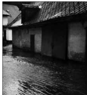
Voda u „mlejna

V zimě roku 2000 bylo poměrně velké množství sněhu. Očekávalo se pomalé oteplování a postupné tání sněhu. Bohužel meteorologická hlášení začala signalizovat velké oteplení s možností dešťových srážek. Tato předpověď se vyplnila ráno 8. března 2000, kdy začalo vydatně pršet a přšlo i celou noc a druhý den. Ráno 9. března byl vyhlášen 2. stupeň povodňové aktivity. V poledne téhož dne byl vyhlášen již 3. stupeň. Byli povoláni hasiči, kteří začali vystěhovávat spoluobčany bydlící blízko řeky. Přivezl se písek, kterým se plnily pytle a z těch se stavěly bariéry, aby se voda nemohla rozlévat dál nebo nezaplavovala obydlí. Hasiči pomáhali, kde to bylo