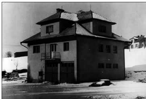
Hasičárna před opravou