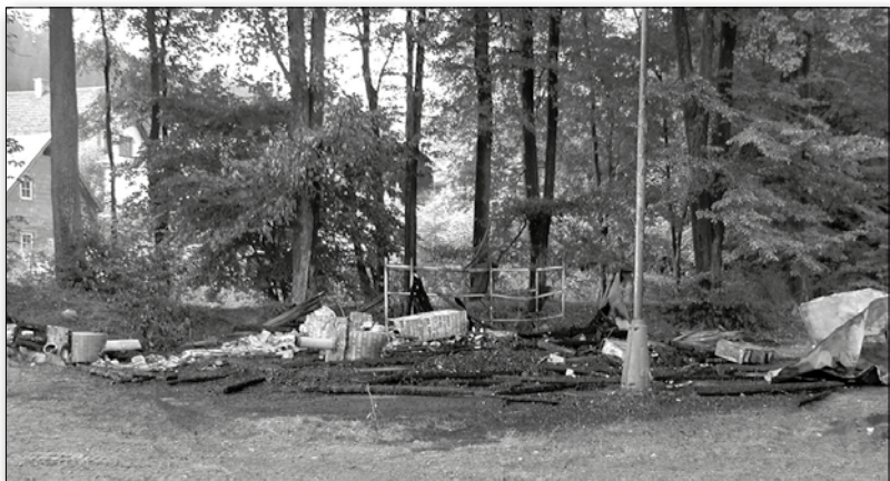
Požár hokejových kabin 1.9.2008