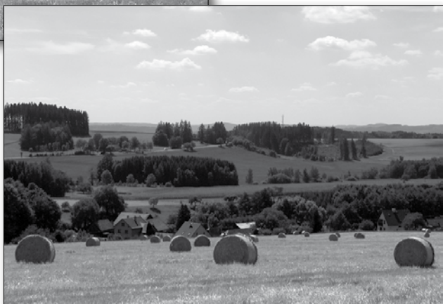
Letní snímky části horní Necoře