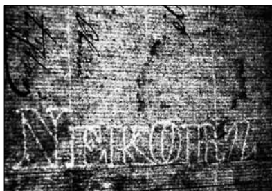
Foto –listu papíru vložený do kroniky obce a zobrazení jeho průsvitky