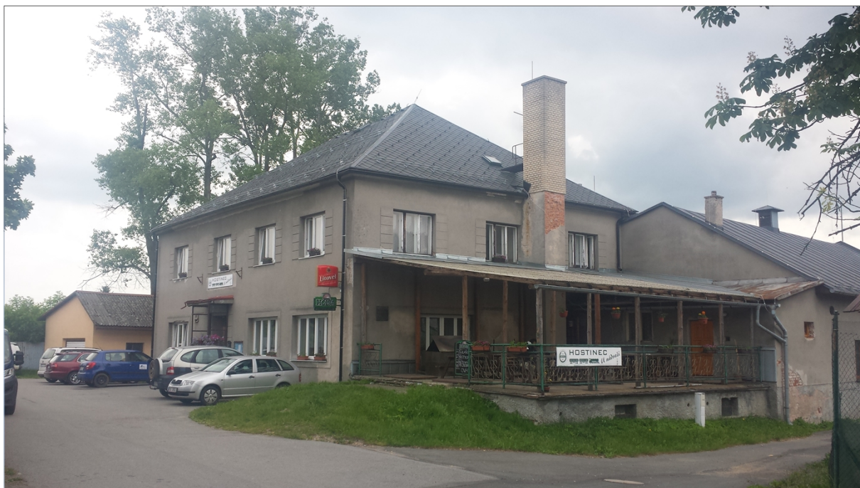
fotografie objektu k pronájmu

Lichkov čp. 203, psč. 561 68 – výdejní místo Lichkov, okr. Ústí nad Orlicí